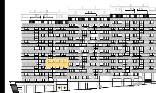
ALZADO RÚA MORCEGO