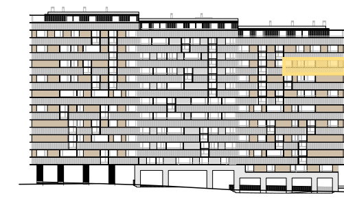
ALZADO Z. VERDE