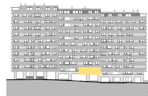
ALZADO ZONA VERDE