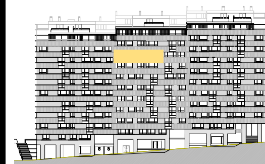
ALZADO RÚA MORCEGO