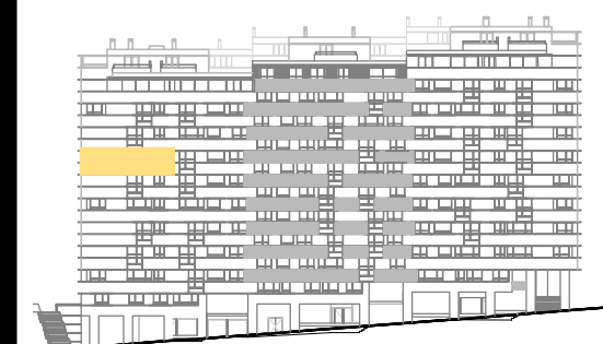
ALZADO RÚA MORCEGO