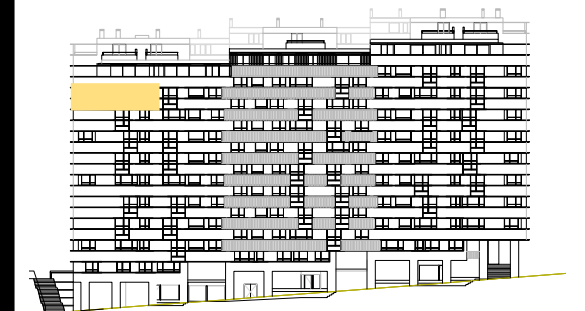
ALZADO RÚA MORCEGO

0 1 3 5 POR EXIGENCIAS TÉCNICAS O JURÍDICAS, ESTE PLANO PUEDE SUFRIR MODIFICACIONES. AMUEBLAMIENTO NO INCLUIDO. PLANO EN FASE DE PROYECTO BÁSICO. DOCUMENTACIÓN NO CONTRACTUAL