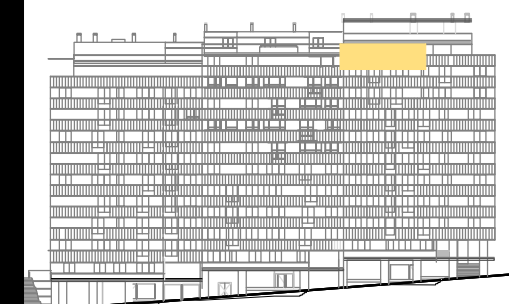
ALZADO RÚA MORCEGO