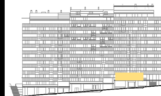
ALZADO RÚA MORCEGO