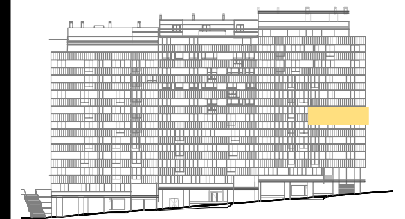
ALZADO RÚA MORCEGO