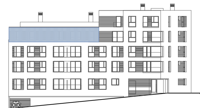
C/ M a Victoria de la Fuente Alonso