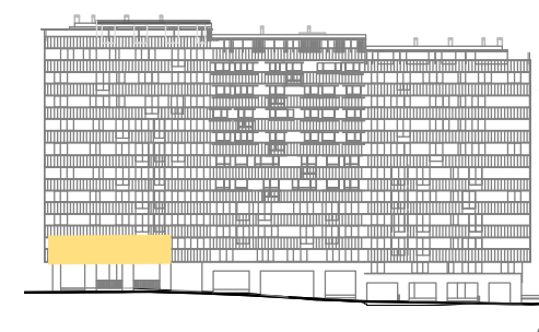
ALZADO ZONA VERDE