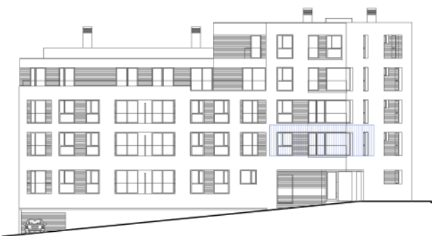
C/ M a Victoria de la Fuente Alonso