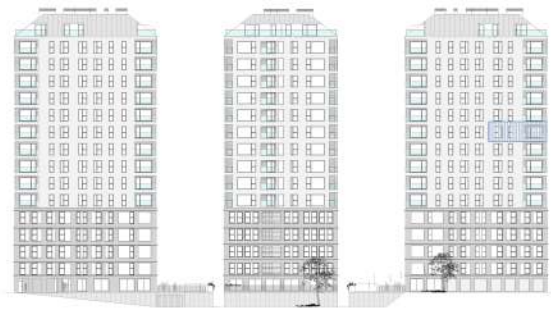
C/ Mercedes Núñez Targa